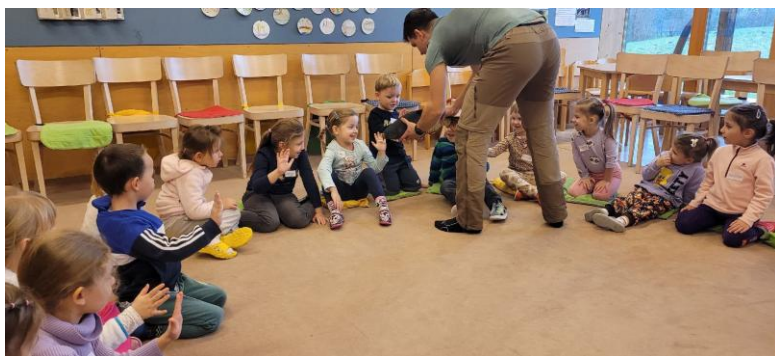
EVVO ve Sluňákově – S panem kaprem pod vodu