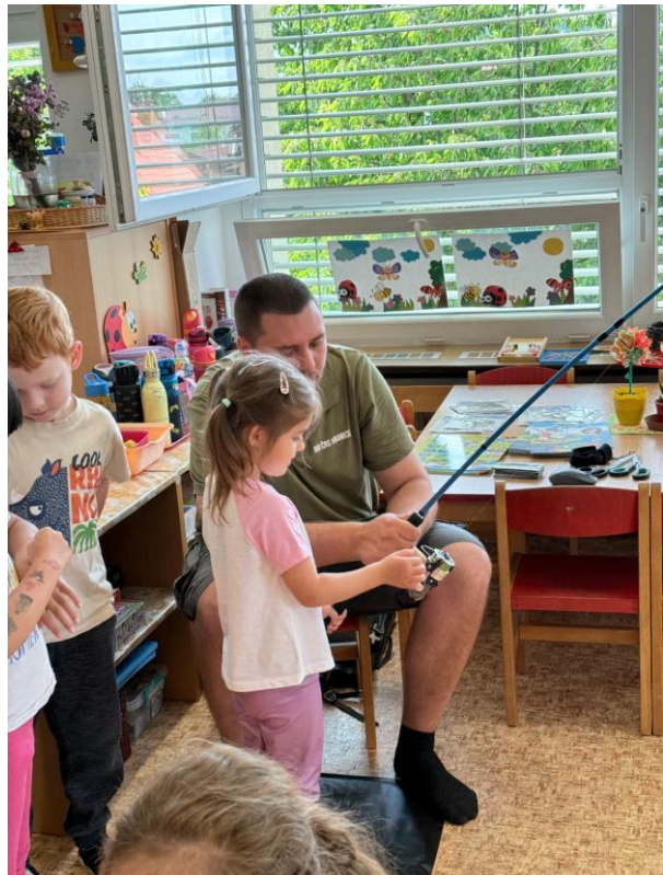
Spolupráce s rodiči – ukázka rybaření