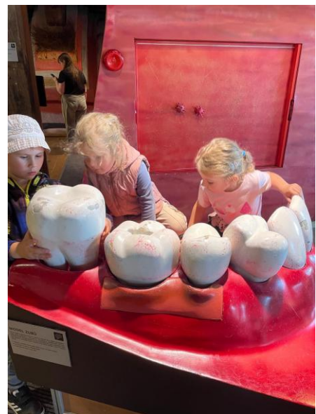
EVVO Pevnost poznání