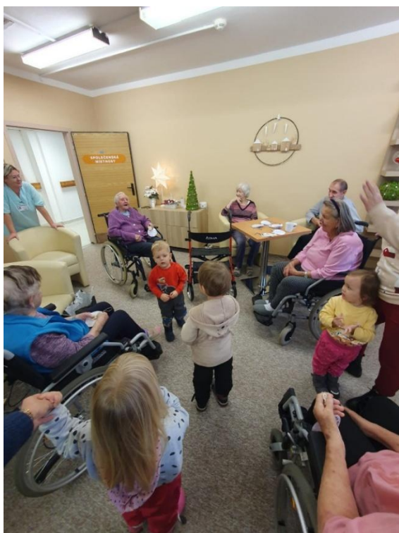
Návštěva Domova seniorů Hranice

Vedení školy se účastní pravidelných setkání a realizuje projekt MAP v rámci pracovní skupiny předškolního vzdělávání a setkávání ředitelů škol a školských zařízení.