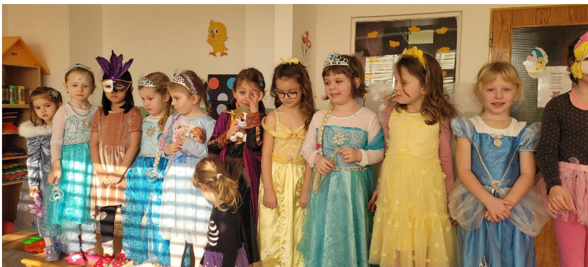
Karneval v MŠ