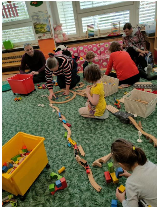
Hravé odpoledne s rodiči