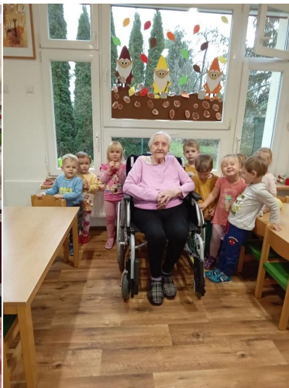
Návštěva „kouzelné“ babičky z Domova seniorů