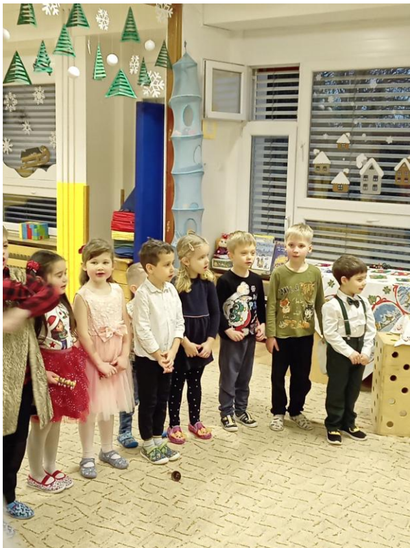
Vánoční dílničky s besídkou