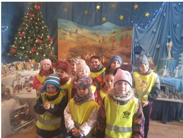
Návštěva Galerie M+M