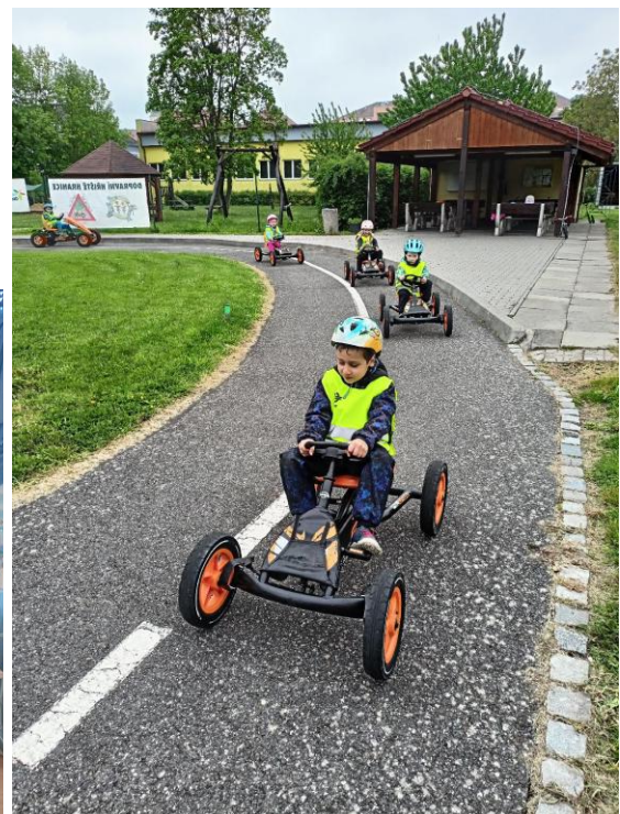
Návštěva dopravního hřiště