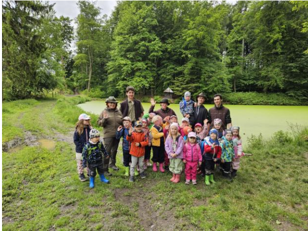
EVVO ve Valšovicích