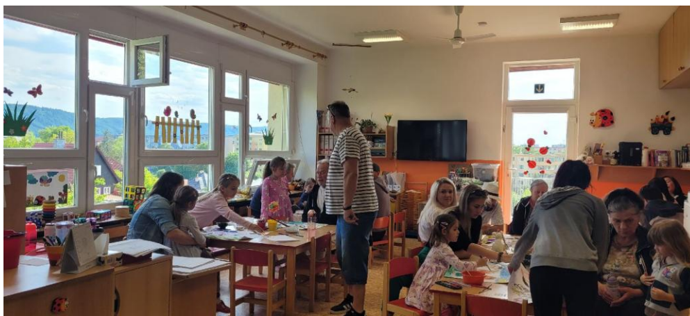
Kresba rodinného portrétu s panem Dostálem