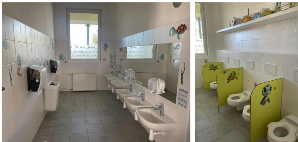
Nové dětské koupelny a toalety – oprava havarijního stavu vodoinstalace a kanalizace