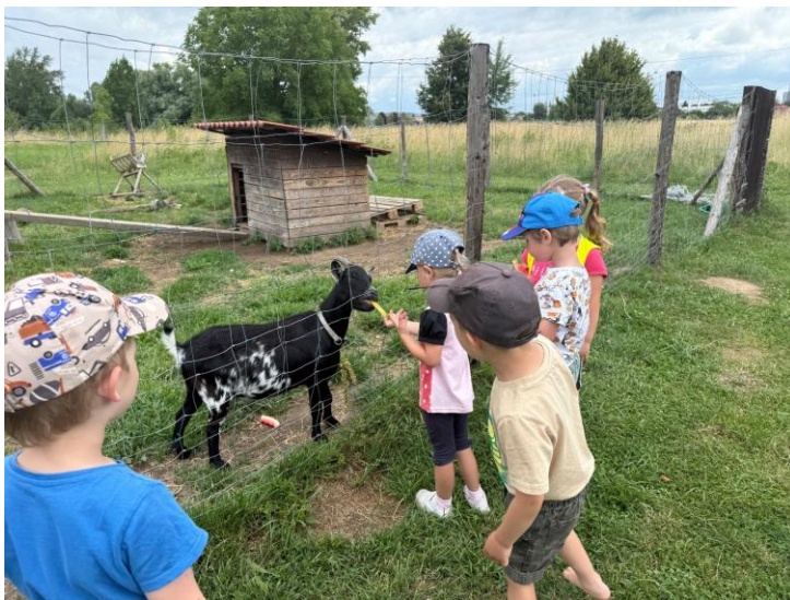
Dopolední vycházka do přírody